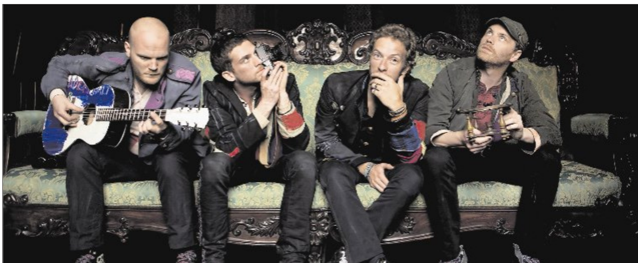
Den beschränkenden Ballast abzuwerfen, hat dazu geführt, dass Coldplay auf dem besten Wege sind, musikalische Leichtgewichte zu werden.

Live: Sonnabend, 21. Juni, um 19.30 Uhr in der HSH Nordbank Arena (ehemals AOL Arena), Hamburg.